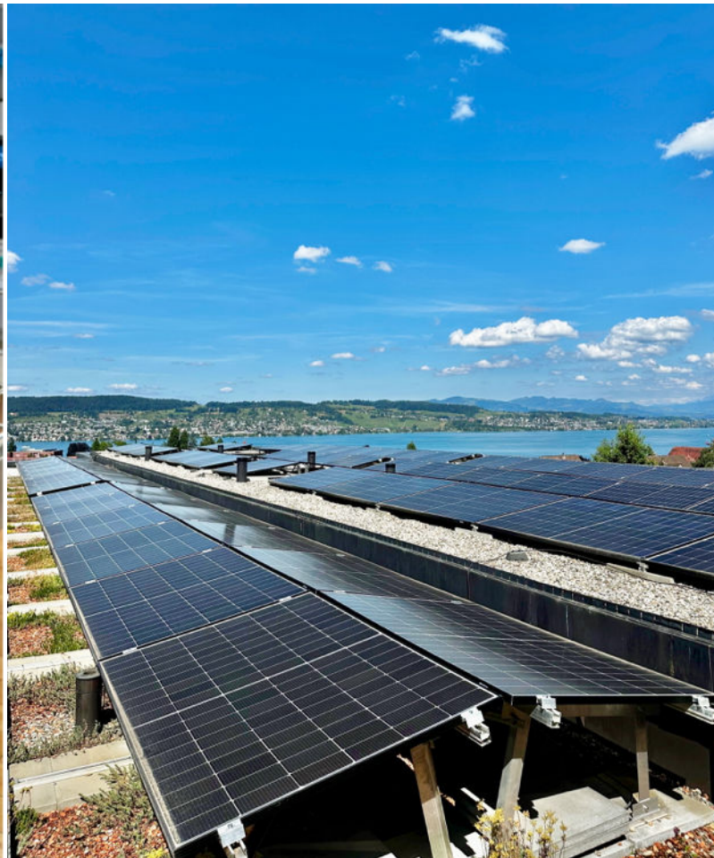
Photovoltaik-Anlage. Auf dem Dach in Wädenswil werden 10 Prozent des Energiebedarfs produziert.

Alle Bereiche des Alterszentrums Frohmatt eruieren laufend mögliche Massnahmen, um Ressourcen zu schonen. So wird die Digitalisierung der Prozesse und Ablagen weiter vorangetrieben. Das gesteckte Ziel ist, in sämtlichen Bereichen die administrativen Unterlagen